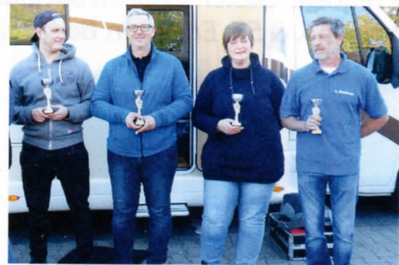
Hier die „Besten“

Somit konnten dann die 13 Fahrer für die Tageswertung (offen für alle Interessierten) und die 10 Fahrer zur Clubmeisterschaft bei diversen Einparkübungen, Gateranfahrungen sowie Slalom, sowohl vorwärts als auch rückwärts zu fahren, ihr Können unter Beweis stellen. Da in der Wertung in erster Linie die Fehlerpunkte zählen ist man immer gut beraten, es in Ruhe angehen zu lassen; und weil es pro Wertung zwei Durchläufe gibt, braucht sich niemand Streß machen. Nur bei Punktgleichheit wird die schnellere Fahrzeit zur Wertung herangezogen. Somit kann sich jeder Fahrer recht entspannt auf den Weg machen und auch Fahranfänger sind hier gut aufgehoben, denn wie wir ja alle wissen: „Übung macht den Meister.“ Und